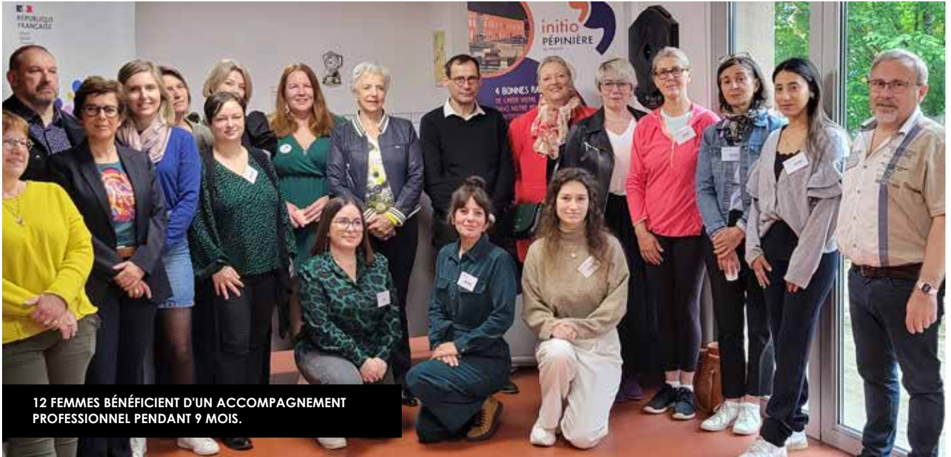
12 FEMMES BÉNÉFICIENT D'UN ACCOMPAGNEMENT PROFESSIONNEL PENDANT 9 MOIS.