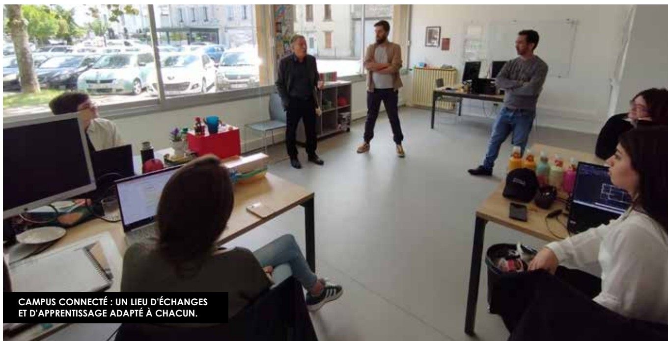
CAMPUS CONNECTÉ : UN LIEU D'ÉCHANGES ET D'APPRENTISSAGE ADAPTÉ À CHACUN.