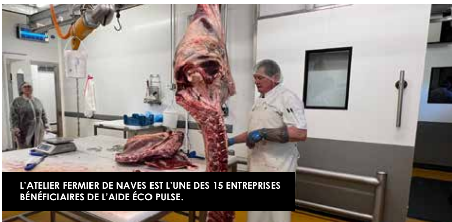
L'ATELIER FERMIER DE NAVES EST L'UNE DES 15 ENTREPRISES BÉNÉFICIAIRES DE L'AIDE ÉCO PULSE.