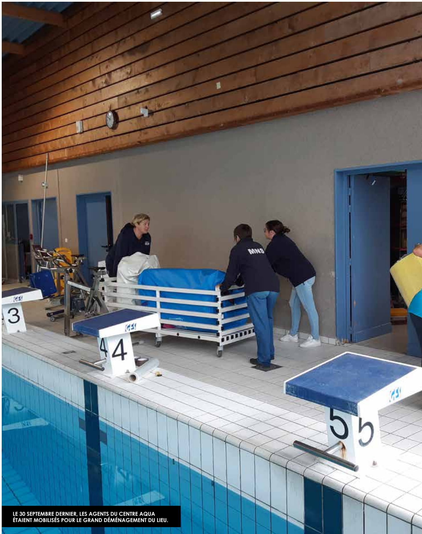
LE 30 SEPTEMBRE DERNIER, LES AGENTS DU CENTRE AQUA ÉTAIENT MOBILISÉS POUR LE GRAND DÉMÉNAGEMENT DU LIEU.