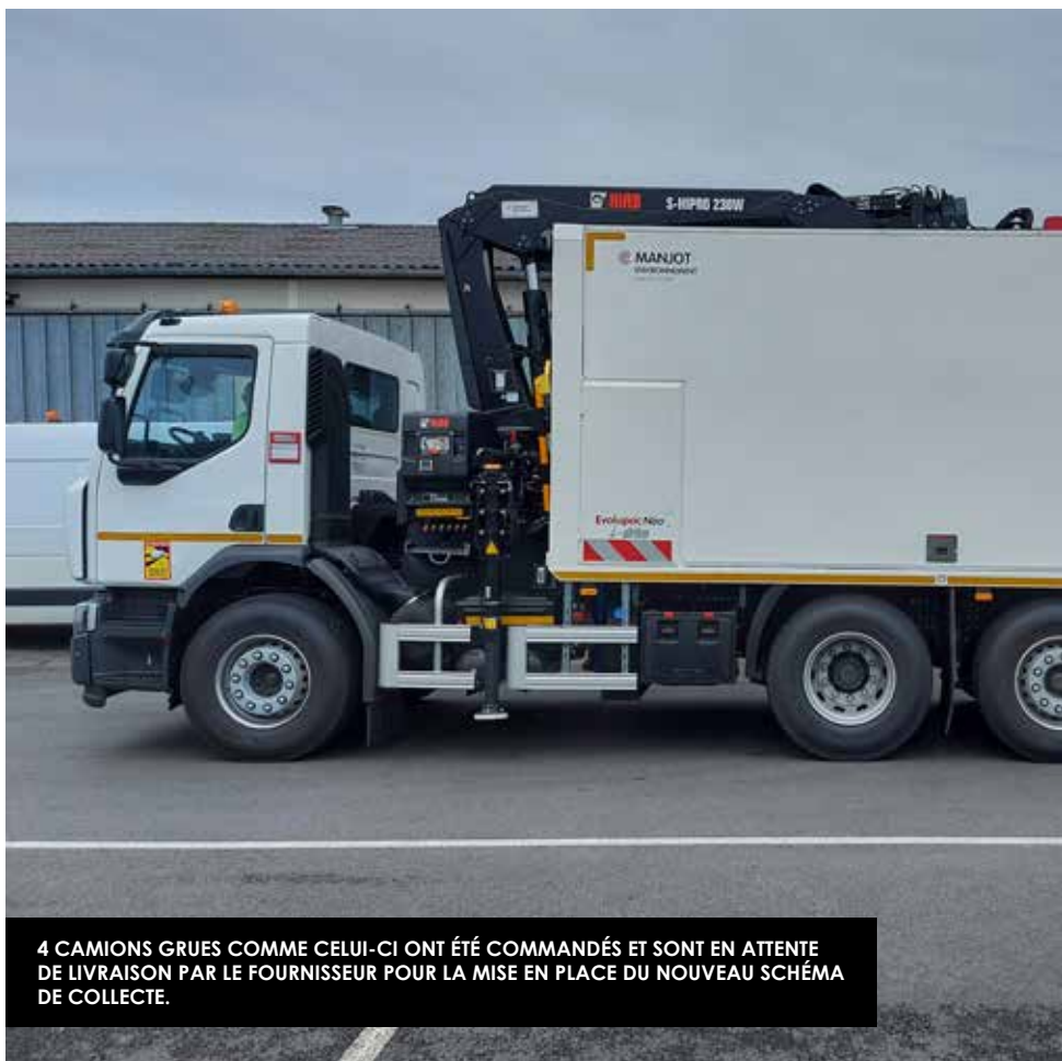
4 CAMIONS GRUES COMME CELUI-CI ONT ÉTÉ COMMANDÉS ET SONT EN ATTENTE DE LIVRAISON PAR LE FOURNISSEUR POUR LA MISE EN PLACE DU NOUVEAU SCHÉMA DE COLLECTE.

Les (futurs) colonnes d'ordures ménagères et (nouvelles) colonnes d'emballages recyclables, doivent être collectées avec des camions-grues équipés d'un système de grappin performant et nouvelle génération. Outre la nécessité de renouveler le parc de véhicules vieillissants, le service Collecte