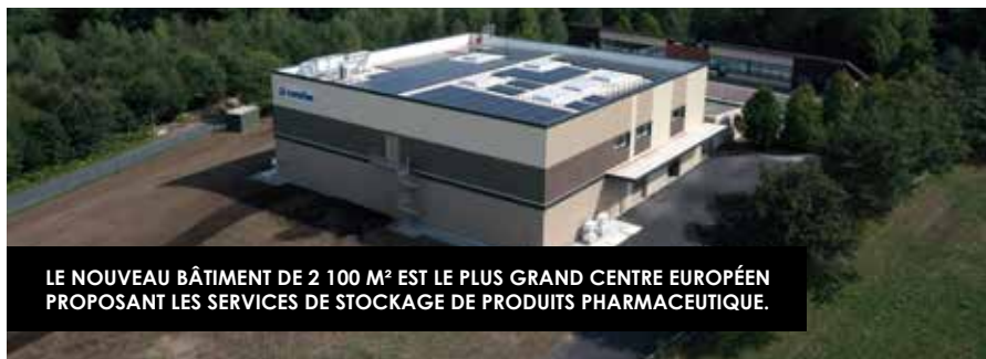
LE NOUVEAU BÂTIMENT DE 2 100 M 2 EST LE PLUS GRAND CENTRE EUROPÉEN PROPOSANT LES SERVICES DE STOCKAGE DE PRODUITS PHARMACEUTIQUES.