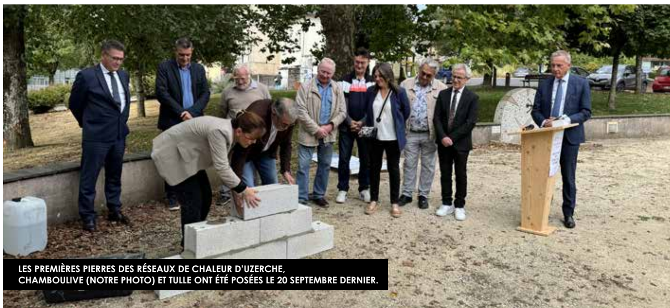
LES PREMIÈRES PIERRES DES RÉSEAUX DE CHALEUR D'UZERCHE, CHAMBOULIVE (NOTRE PHOTO) ET TULLE ONT ÉTÉ POSÉES LE 20 SEPTEMBRE DERNIER.